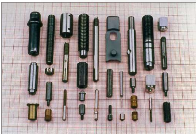
Esempio di alcuni particolari prodotti su TSM 280