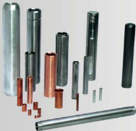
Esempio di alcuni particolari prodotti su TSM 280T

La macchina da filo WOLF TSM 280 viene fornita equipaggiata per la produzione del particolare richiesto dal cliente e pronta all'uso.