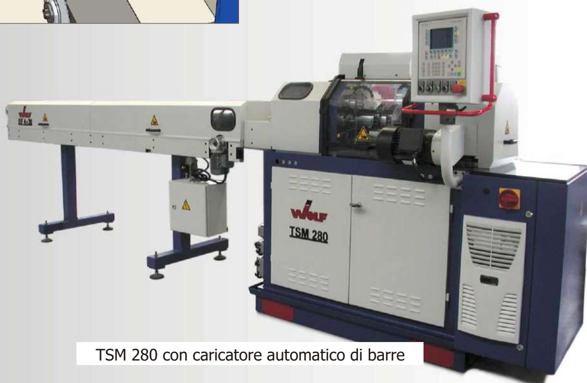
TSM 280 con caricatore automatico di barre

L'applicazione di diversi utensili, così come la possibilità di regolare la velocità dei mandrini di lavoro, conferiscono a questo modello una posizione Leader nel mercato.