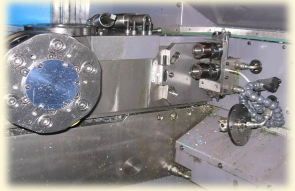
2 Utensili per lavorazioni posteriori di ripresa